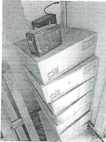
Fotografski snimak sa lokacije uzorkovanja