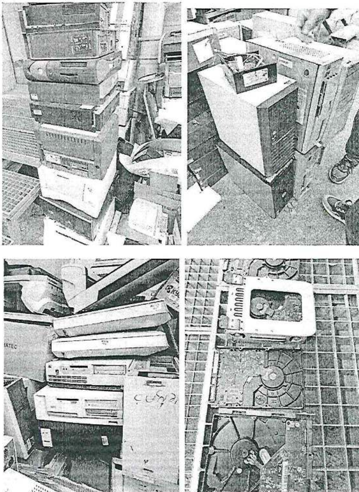
Fotografski snimci sa lokacije uzorkovanja